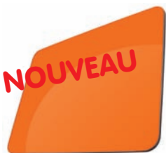
ORANGE - RAL 2004*