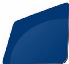
BLEU - RAL 5002