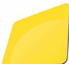
JAUNE - RAL 1023