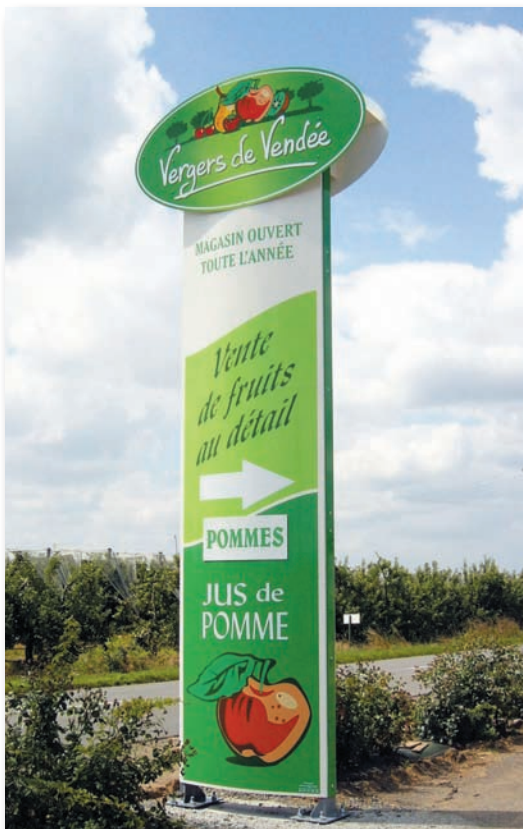
Le MatelBond a une excellente résistance à la charge du vent. Ouest Enseignes (85)