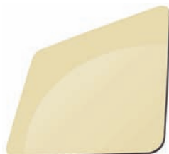
IVOIRE - RAL 1015