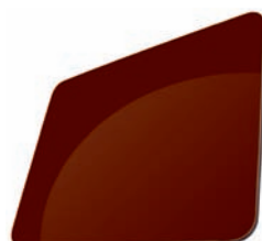
CHOCOLAT - RAL 8015