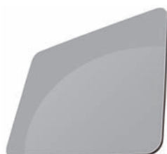
GRIS - RAL 9006