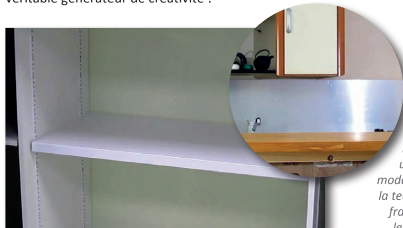
Tablette de placard ultra-résistante et crédence de cuisine réalisées en MatelB30