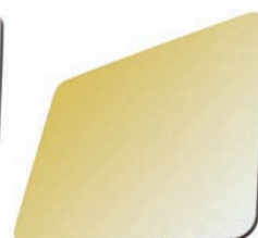
POLI MIROIR DORÉ

L'élégance des réalisations en miroir sans la fragilité, grâce à la grande résistance et l'usabilité du MatelBond.