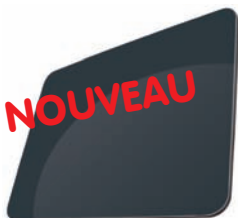
GRIS ANTHRACITE - RAL 7016