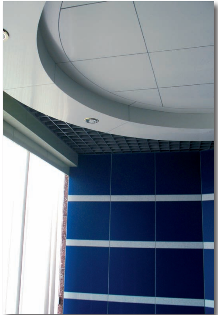
Habillage de cloisons et plafonds en MatelBond avec la technique de fabrication de cassettes.

Idéal pour la pose d'adhésif, il peut également être sérigraphié ou imprimé par impression numérique.