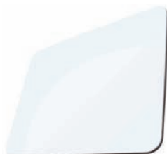
BLANC - RAL 9016

La série MatelBond laquée offre une large gamme de couleurs mates et brillantes.