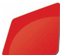
ROUGE - RAL 3020