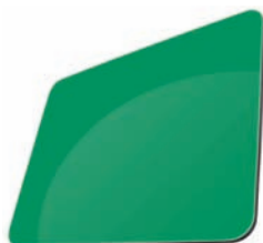
VERT - RAL 6024