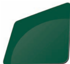
VERT JARDIN - RAL 6005