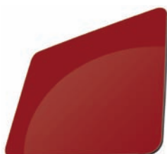
BORDEAUX - RAL 3011