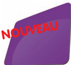
VIOLET - RAL 4008*