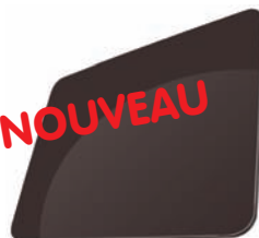
BRUN GRIS - RAL 8019