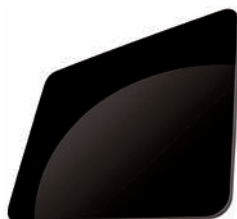
NOIR - RAL 9005