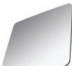
POLI MIROIR ARGENT